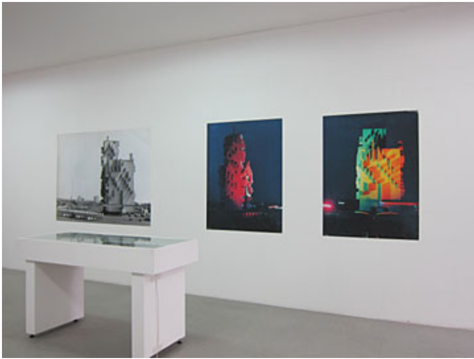
Wild beamen maar dan anders. GEB-kantoor Arnhem – wat een gebouw! – in full colour.