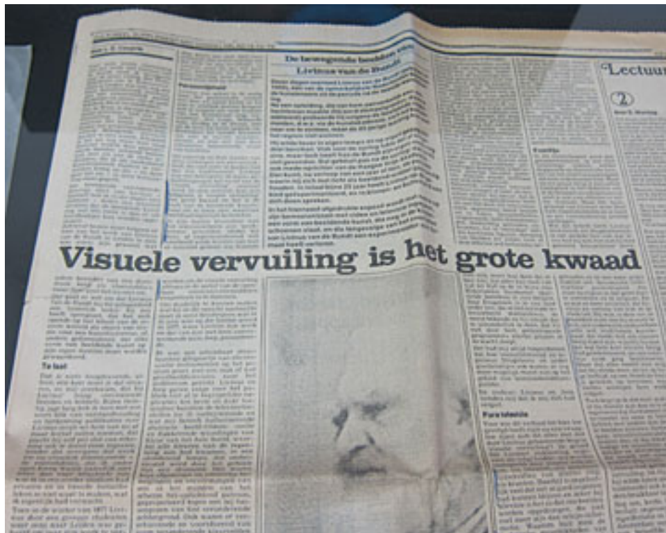
Schitterende tentoonstelling "De Vluchtkoffer van LIVINUS".

Om de hoek bij GEMAK weten ze het zeker: